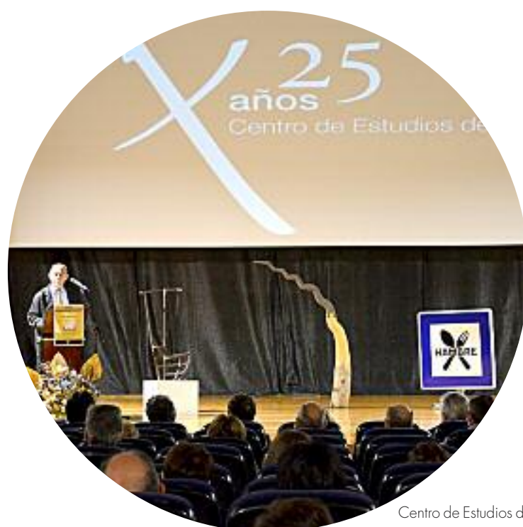
Centro de Estudios del Jiloca