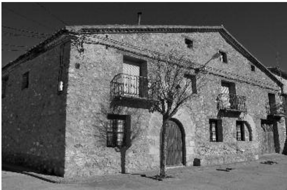
Plaza del Boticario.

quitectónicos que se mantienen todavía homogéneos a pesar de alguna intervención poco afortunada.