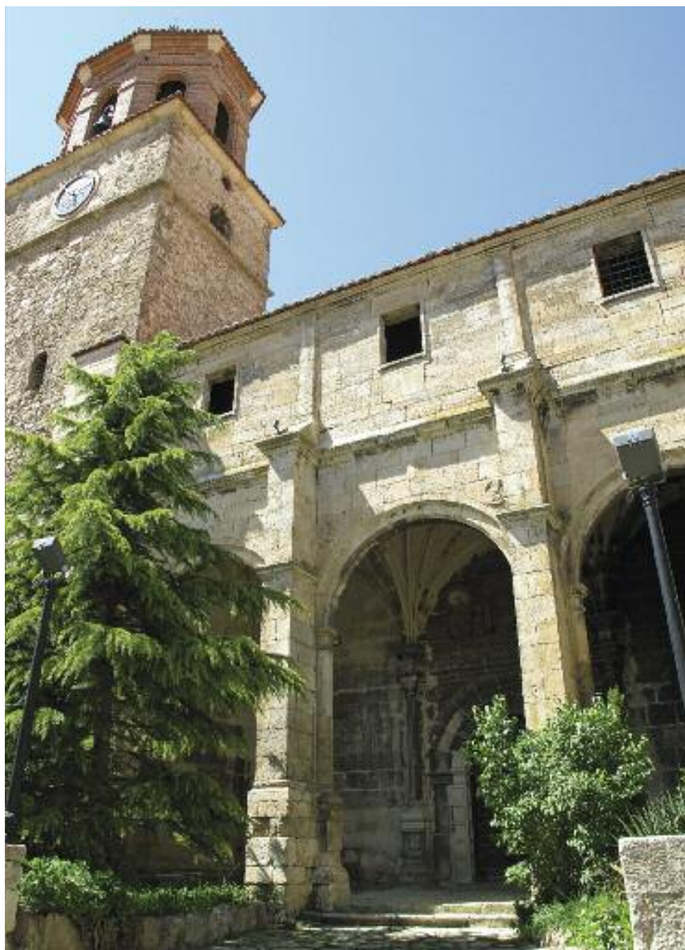
Iglesia Parroquial del Salvador.