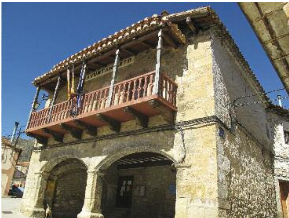
Ayuntamiento de Terriente.

Su ayuntamiento renacentista, el más antiguo de la zona, está presidido por un balcón corrido de madera. La singularidad del edificio la otorga su lonja inferior de dos arcos rebajados y la segunda planta con dos vanos adornados con arcos mixtilíneos tallados con delicados adornos gotizantes. Y sin duda, su parroquial, donde todavía se aprecian sus rasgos góticos en su cubierta de bóvedas de crucería estrellada, donde destaca la capilla del Cristo de Las Nieves, y al exterior su excelente portada manierista de tipo serliano, estilo usual en otras iglesias del entorno, friso con motivos platerescos y decorado con terceletes. Una obra magistral de los hermanos Avajas y Utienes 2 .