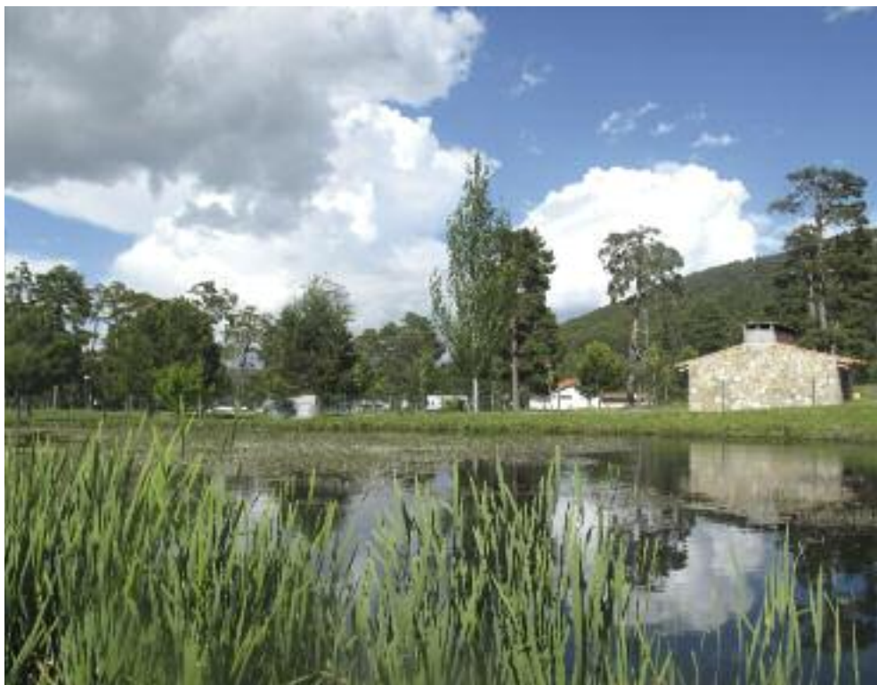
Camping El Algarbe.