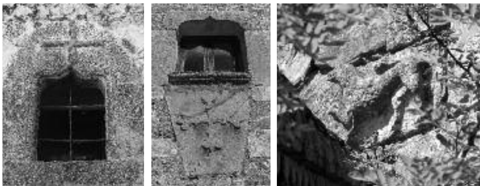
Ventanales góticos (imagen superior e inferior), cruces, animal fantástico en el lienzo del muro exterior de la iglesia.

recreativas de la Sierra. Será difícil encontrar un prado tan amplio que presuma de una superficie de césped tan llana como pulcramente cuidada.