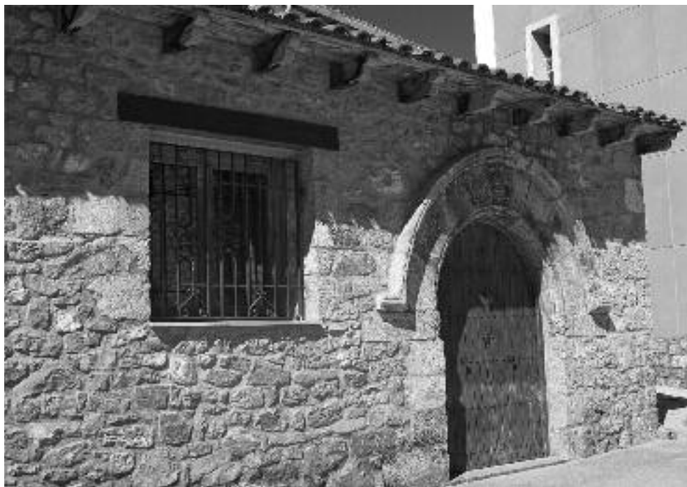
Portada medieval en C/ San Juan.