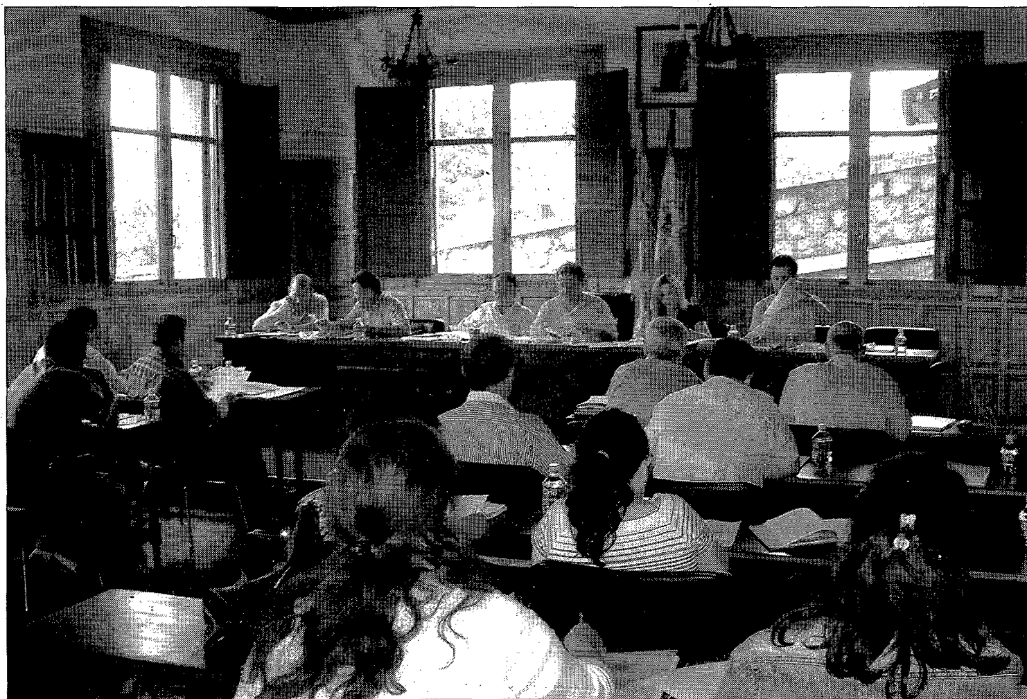
El pleno de la Comunidad de Albarracín trató la situación en la que se encuentra su proyecto emblemático para atraer el turismo