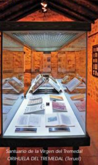
Santuario de la Virgen del Tremedal ORIHUELA DEL TREMEDAL (Teruel)