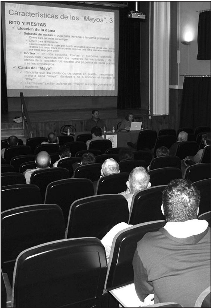
Esta II Jornada sobre patrimonio se realizó en el antiguo cine