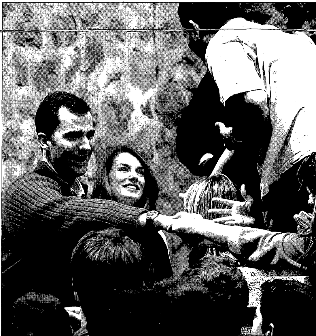
En la imagen de la izquierda, los recién casados se miran cariñosamente durante su paseo por las calles de la Ciudad de los Azagra; en la fotografía superior, Felipe de Borbón y Letizia Ortiz saludan sonrientes a un buen número de personas que aprovechó para felicitarles por su matrimonio