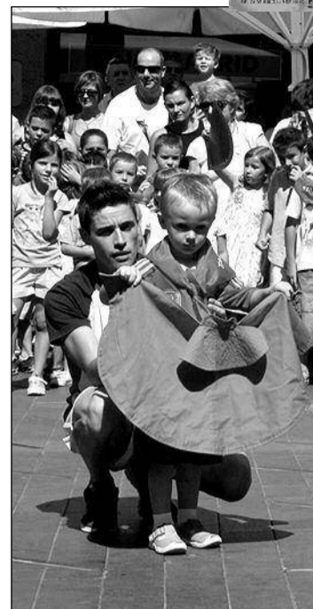
Varios niños tentando a los astados de cartón piedra, e incluso saltando sobre ellos, en el encierro infantil celebrado ayer en la plaza del Torico